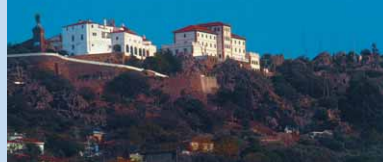
Santuario de Ntra. Sra. de la Montaña

se data desde el s. XIII la parte más antigua hasta el s. XVII, con una magnífica fachada renacentista en cuya parte superior se observa el escudo de Galarza.