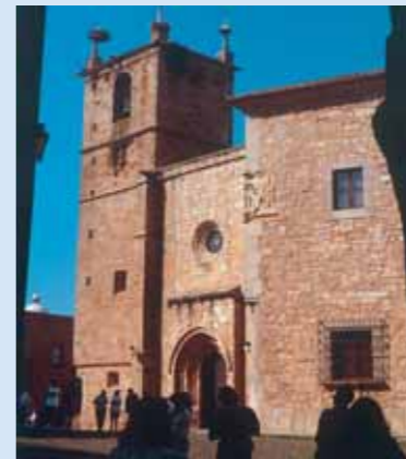
Concatedral de Santa María

El Palacio Episcopal, frente a la fachada principal de la Concatedral,