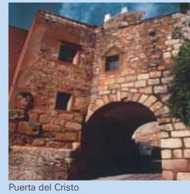
Puerta del Cristo