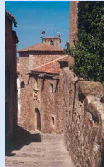
Casa de Espadero - Pizarro