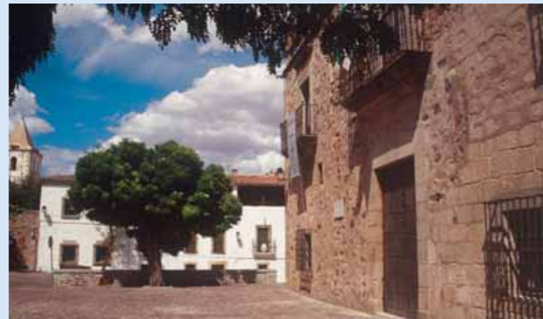
Casa de las Veletas

de la ciudad, como la romana, medieval o relacionada con el descubrimiento de América.