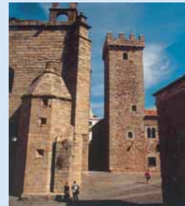
Iglesia de Santiago