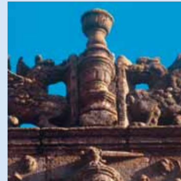
Detalle de la fachada del Palacio de los Gólfines de Abajo

Mansión de Hernando de Ovando, el que fuera hermano del primer gobernador de La Española, Fray Nicolás de Ovando. Junto al Palacio Episcopal se halla este palacio construido a finales del s. XV, de estilo renacentista y que sería reformado en el XVIII.