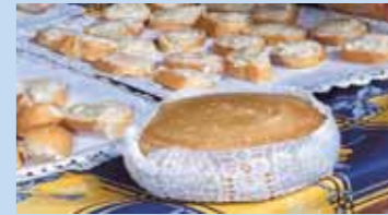
Torta del Casar

Chanfaina. Patatas en escabeche con tenacas. Caldereta extremeña. Perdiz con miel y azúcar. Gazpacho cacereño. Escabechera navideña. Liebre al modo de Cáceres. Migas extremeñas. Torta del Casar. Embutidos y jamones. Vinos y licores, dulces conventuales y artesanales: perrunillas, rosquillas de alfajor, etc.