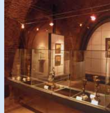
Museo de la Casa de los Caballos