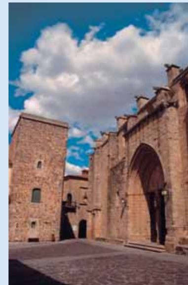
Concatedral y Palacio de los Ovando