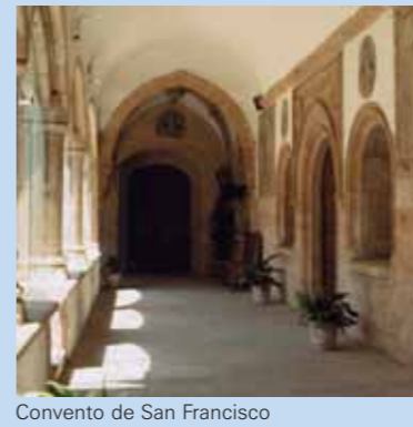
Convento de San Francisco

Construido en el s. XVI, es una muestra maravillosa de estilo renacentista cacereño, con claros elementos medievales en su bella fachada.