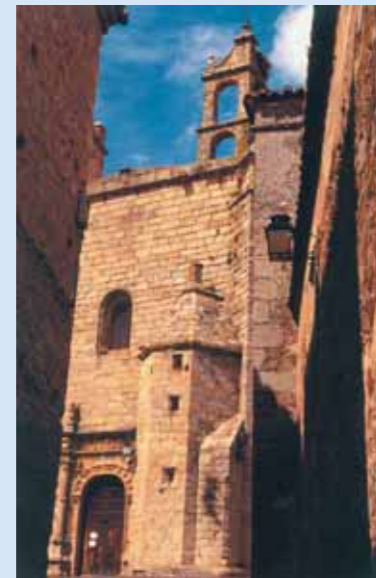
Iglesia de San Mateo