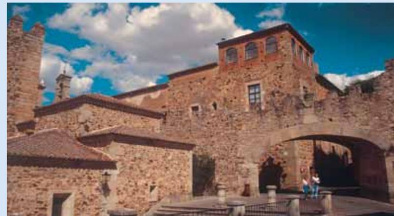
Arco de la Estrella y Ermita de la Paz