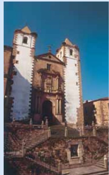
Plaza de San Jorge