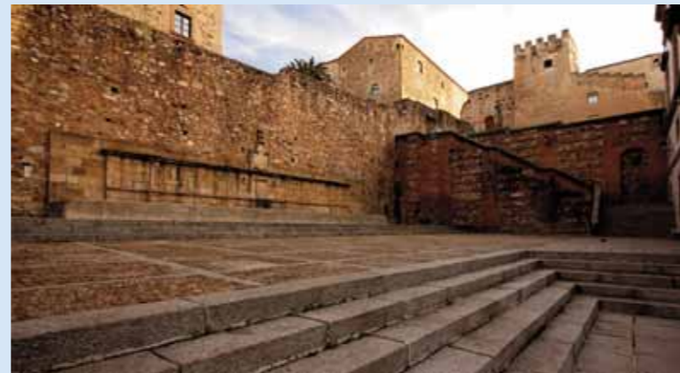
Foro de los Balbos