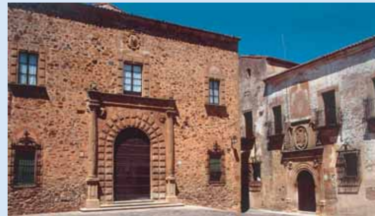
Palacio Episcopal y Palacio de Ovando

PALACIO DE MAYORALGO Su construcción es de los siglos XIV y XV y tiene una hermosa fachada del XVI con portada de medio punto, ventanas geminadas y un hermoso escudo de la familia Mayoralgo. En su interior destaca su hermoso patio mudéjar.