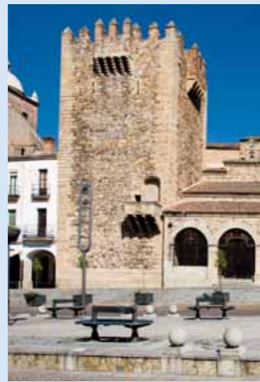
Torre de Bujaco

Desde el s. XIII esta amplia y bella plaza era utilizada como recinto ferial artesanal e incluso para reuniones del Consejo. Los soportales que la rodean, utilizados por comerciantes y artesanos, con arcos sobre pilares son del s. XVI. En el lado oriental, cercano al Ayuntamiento, se observan las murallas almohades que datan del s. XII.