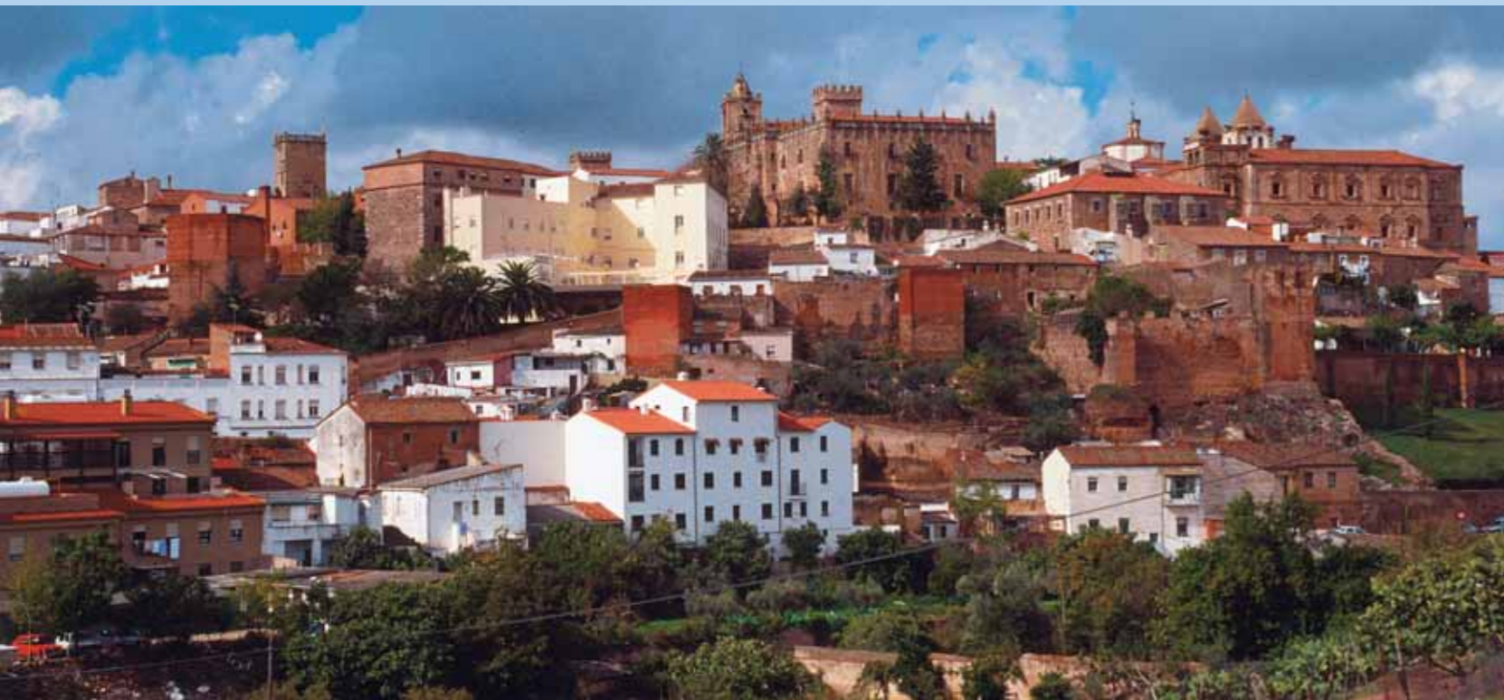
Vista de Cáceres

bel de Castilla en su lucha por la Corona de Castilla. En el s. XVI la ciudad completará casi definitivamente su conjunto monumental con la construcción de la mayoría de los palacios y casas señoriales del Cáceres monumental, con rasgos típicos de edificios de marcado carácter defensivo bajo la influencia del estilo renacentista. Capital de la Alta Extremadura y de la provincia cacereña, la ciudad de Cáceres es actualmente la segunda ciudad más poblada de Extremadura, importante centro universitario extremeño y desde 1986 reconocida por la UNESCO como Ciudad Patrimonio de la Humanidad.