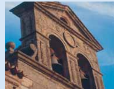
Convento de San Pablo (detalle)

estilo gótico tardío posee una interesante capilla renacentista. Su bella puerta plateresca y el retablo rococó, de Vicente Barbado del siglo XVIII, llaman la atención junto a los numerosos sepulcros de granito que en su interior se hallan.