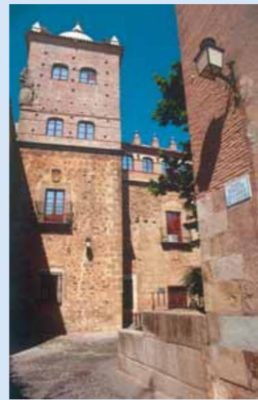
Palacio de los Toledo Moctezuma

Limitrofe con la Plaza Mayor, esta zona tan atractiva en torno al amurallamiento cacereño conserva nombres como el de la Estrella, Santa Ana o Pedro Rosalio.