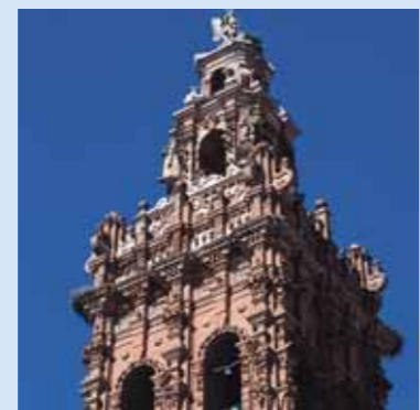
Iglesia de San Miguel. Torre barroca