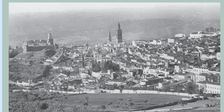
Vista de la Fortaleza y la Iglesia de Santa María a principios del siglo XX.