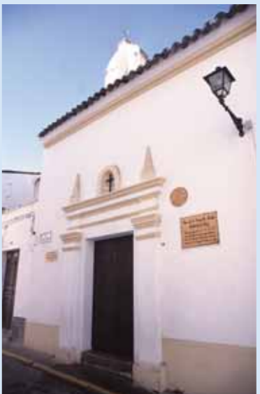
Capilla de la Madre Isabel de la Cruz

to, son las de San Lázaro datada en el siglo XVI como lugar abierto al público, en cuyo altar mayor estaba representado el misterio de San Lázaro, la ermita del Cristo de la Vera Cruz construida a mitad del siglo XVII, fue secularizada en el XIX con una bella portada exterior del lado del Evangelio y las ermitas de Santiago documentada en el siglo XV, la puerta de La Alhóndiga, la ermita de San Roque cercana a la parroquia de San Bartolomé y la de San Lorenzo en el barrio de Santa Catalina originaria de 1740.