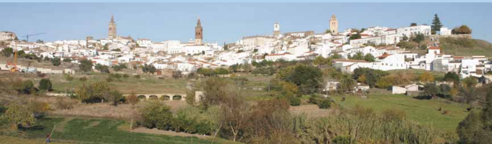
Panorámica de Jerez de los Caballeros

Ciudad declarada Conjunto Artístico Monumental en 1966, posee un patrimonio histórico artístico de los más sobresalientes de Extremadura, con especial mención a las construcciones religiosas y civiles de estilo barroco, que se unen a las ya sugerentes de estilos renacentista y árabe y que prestan un marco admirable para el lucimiento de su Semana Santa, declarada Fiesta de Interés Turístico Regional de Extremadura.