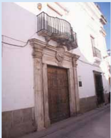
Palacio del Marqués de Rianzuela

Convento de Ntra. Sra. de Gracia. Su fundación se remonta al siglo XV y está ubicado muy cerca de la iglesia parroquial de San Bartolomé, estando regido en la actualidad por