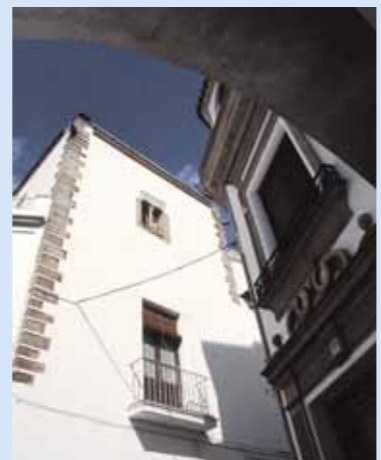
Palacio del Bachiller Juan M. de Logroño

Palacio del Bachiller Juan Martínez de Logroño. Es obra del siglo XV, con una hermosa ventana donde se aprecian sus escudos nobiliarios.