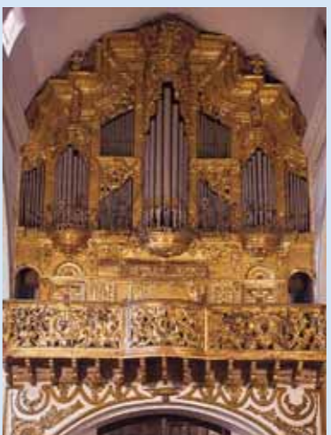
Órgano y Coro de San Bartolomé