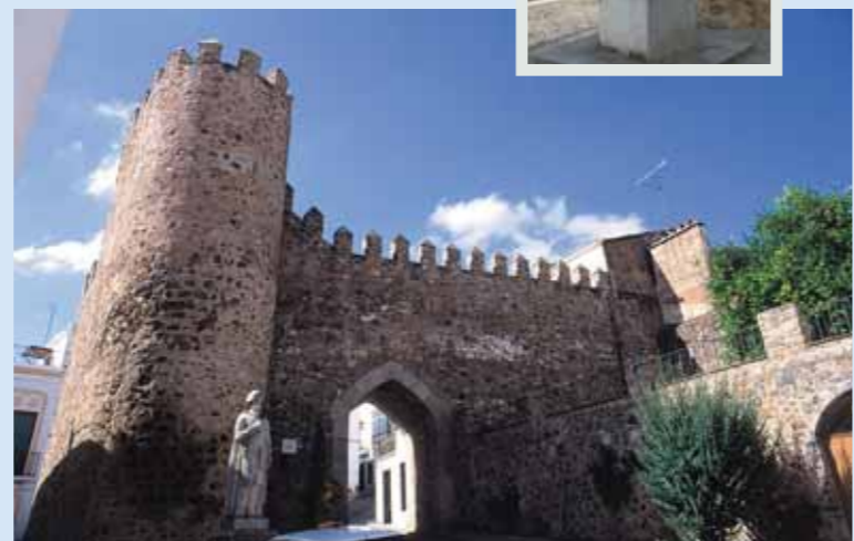
Puerta de Burgos y monumento a Hernando de Soto