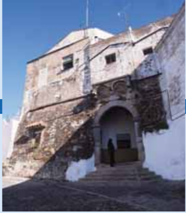
Puerta de la Villa

La Puerta de la Villa en curiosa forma de recodo, se encuentra la popular Capilla de San Antonio y muy cerca, la Fuente de los Santos.