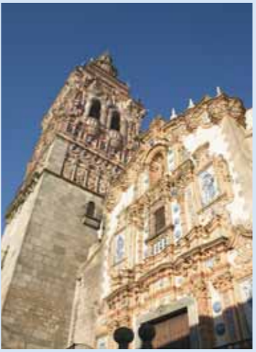
Fachada y Torre. Iglesia de San Bartolomé

El interior del templo es de tres naves, destacando la capilla denominada de los Comendadores con el