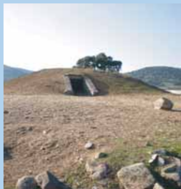
Dolmen del Toriñuelo

Esta ciudad, una de las localidades más prósperas y florecientes de Extremadura, destaca en la producción agrícola y sobre todo en la ganadera, siendo reconocida internacionalmente por la cría del cerdo ibérico, sostén de sus buenos jamones y embutidos ibéricos, celebrándose en primavera el famoso Salón del Jamón Ibérico que reúne a los más reconocidos especialistas del laureado y reconocido "pata negra".