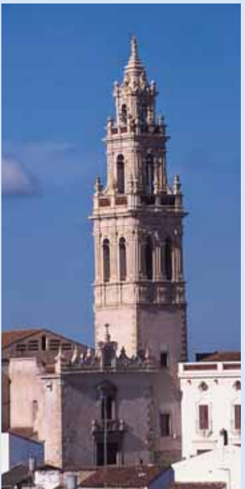
Iglesia de Sta. Catalina

De estilo barroco es su bella fachada, erigiéndose junto a ella su her-