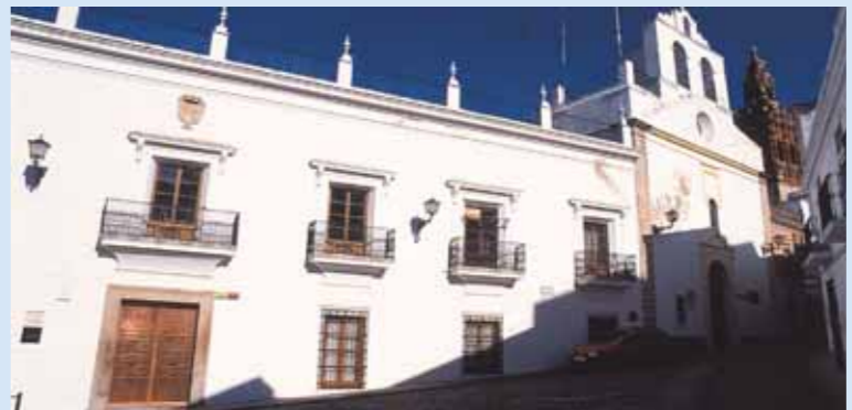
Convento de San Agustín

to, son las de San Lázaro datada en el siglo XVI como lugar abierto al público, en cuyo altar mayor estaba representado el misterio de San Lázaro, la ermita del Cristo de la Vera Cruz construida a mitad del siglo XVII, fue secularizada en el XIX con una bella portada exterior del lado del Evangelio y las ermitas de Santiago documentada en el siglo XV, la puerta de La Alhóndiga, la ermita de San Roque cercana a la parroquia de San Bartolomé y la de San Lorenzo en el barrio de Santa Catalina originaria de 1740.