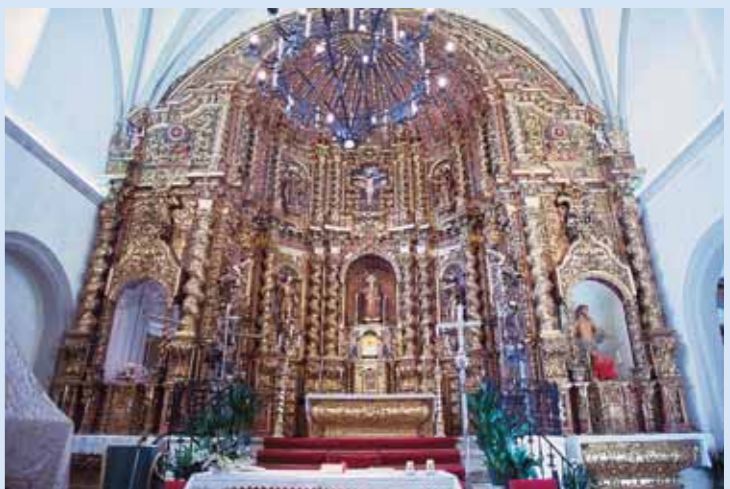
Altar de la Iglesia de Sta. Catalina

mosa torre con aires clasicistas levantada en la segunda mitad del siglo XVIII.