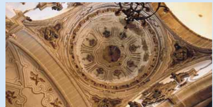
Cúpula Iglesia de Sta. María