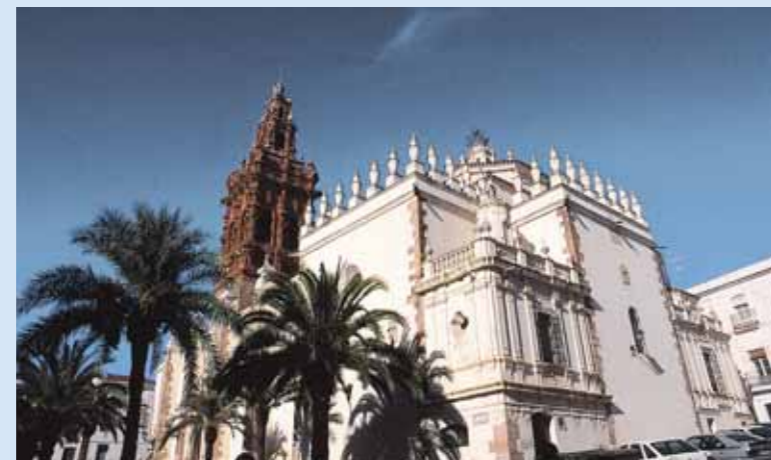
Iglesia parroquial de San Miguel.