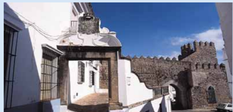
Palacio de Lastra