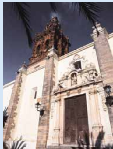
Torre y fachada de la Iglesia de San Miguel

En el siglo XVIII se construyeron la capilla mayor y los dos camarines laterales, sobre la que encontramos una bella cúpula decorada con pinturas donde aparece la Santísima Trinidad.