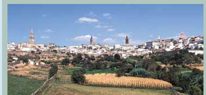
Panorámica de Jerez de los Caballeros en la actualidad