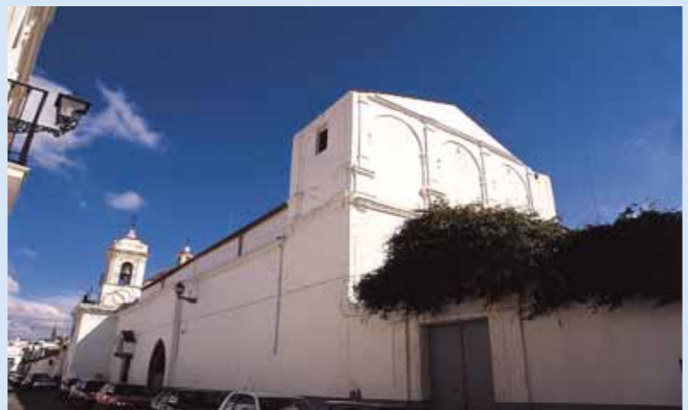
Convento de la Madre de Dios

Otras ermitas jerezanas, que en la actualidad no están abiertas al cul-