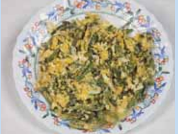
Revuelto de espárragos

El Salón del Jamón Ibérico que se celebra en primavera dentro de su acogedor recinto ferial, reúne a miles de visitantes y a los mejores expositores nacionales. Multitudinarias resultan también los festejos en honor de San Bartolomé y de la Virgen de Aguasantas y las ya típicas y tradicionales "velas de barrios" durante el verano. El mes de julio trae a la ciudad durante unos días su Festival Templario que tiene como eje principal la representación teatral de El último templario de Jerez en su Alcázar, mercado medieval y muestras gastronómicas.