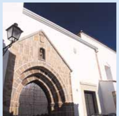
Convento de Ntra. Sra. de Gracia

la Orden Tercera de San Francisco. La capilla mayor tiene una interesante bóveda de crucería en forma de estrella de cuatro puntas y un retablo mayor en estilo barroco que acoge a la Virgen de Ntra. Sra. de Gracia.