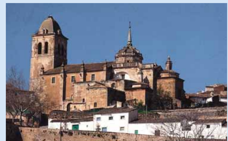
Iglesia de Sta. María